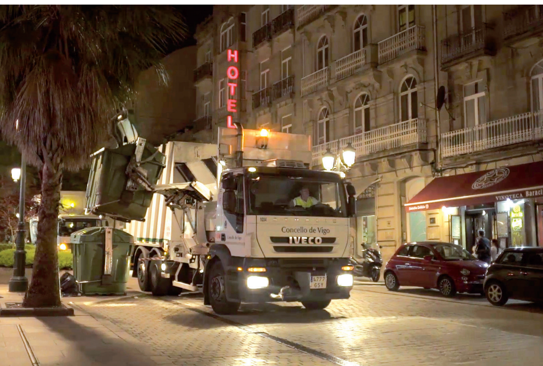
Camión de recogida de residuos sólidos de carga lateral.

En lo que respecta al parque móvil, FCC Medio Ambiente contará con una flota de 59 vehículos para la recogida de reciclables y diversas fracciones de residuos y de 107 máquinas para el servicio de limpieza. En el nuevo contrato se renovará parcialmente la maquinaria introduciendo vehículos eléctricos e híbridos y reforzando la flota actual de gas natural comprimido (GNC).