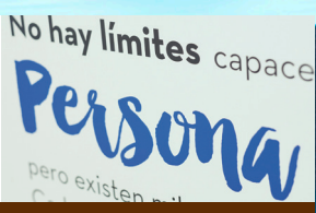
FCC Construcción pone en marcha el proyecto "La Diversidad Suma"

FCC vuelve a la senda del crecimiento, desde una posición saneada y mucho más fuerte