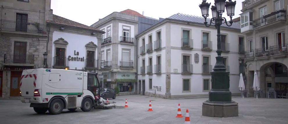
Máquina barredora realizando el servicio de limpieza viaria del casco histórico.

Como novedades, se incrementan los servicios de limpieza y recogida en el casco histórico; asimismo, se pondrán en marcha experiencias piloto de auto-compostaje en unas 2.000 viviendas rurales y también se añadirá un quinto contenedor con llave para la materia orgánica de 4.000 viviendas urbanas.