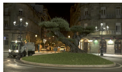
FCC Medio Ambiente contará con una flota de 59 vehículos para la recogida de reciclables y diversas fracciones de residuos.