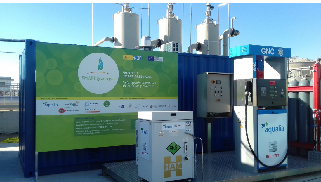
La gasinera del Smart Green Gas suministra biogás obtenido a partir de aguas residuales.

La eficiencia y el uso racional de la energía es un aspecto esencial de la gestión ambiental responsable de Aqualia. La empresa ha implantado