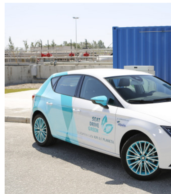
El primer prototipo industrial del proyecto LIFE Memory.