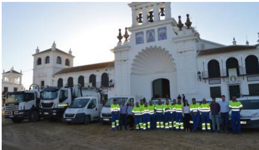
La flota y el equipo de trabajadores de Aqualia, compuesto por 26 personas, frente a la ermita de la Virgen del Rocío.

“ La balsa de aguas residuales llega a acumular cerca de 40 millones de litros que son tratados posteriormente para preservar el entorno del Coto de Doñana ”