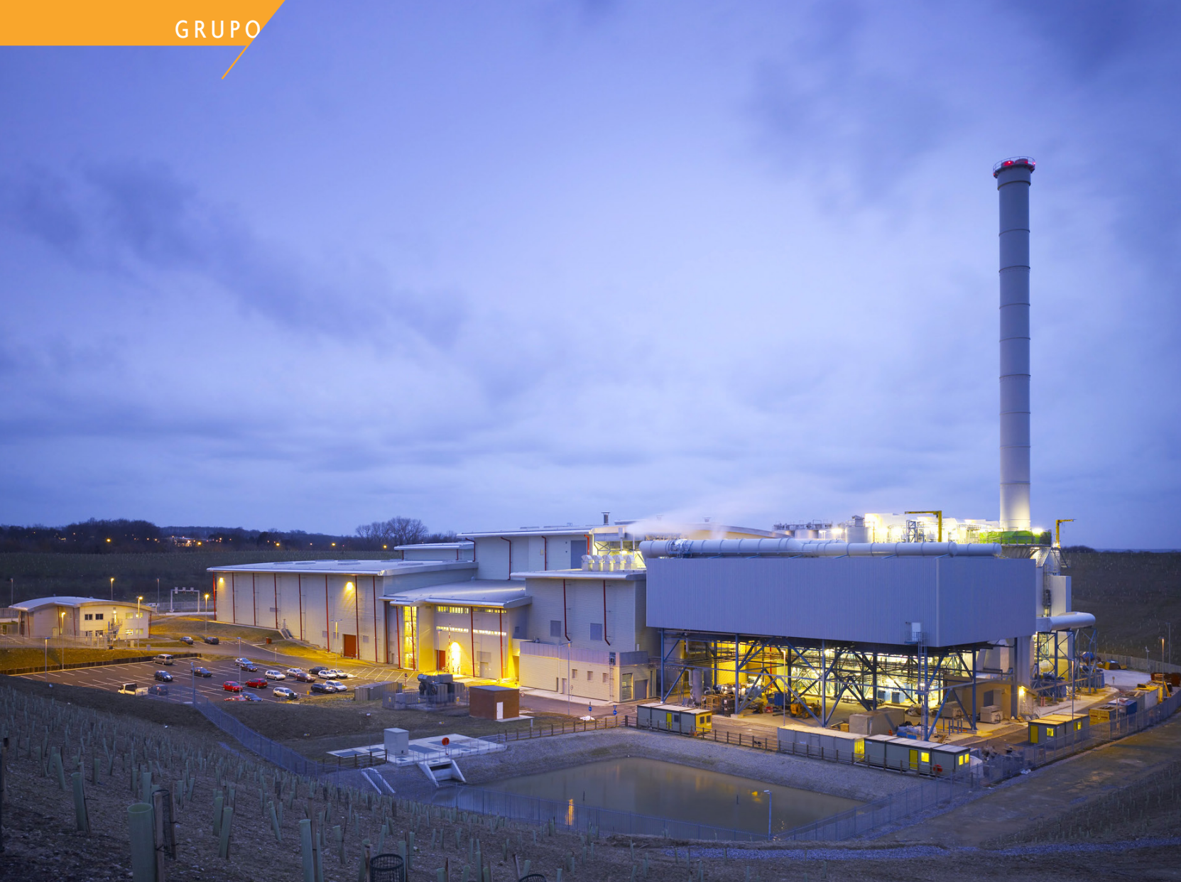
Planta de Allington, Condado de Kent (Reino Unido).