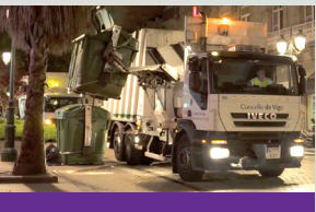
FCC Medio Ambiente gana el contrato de limpieza y recogida de residuos de Vigo