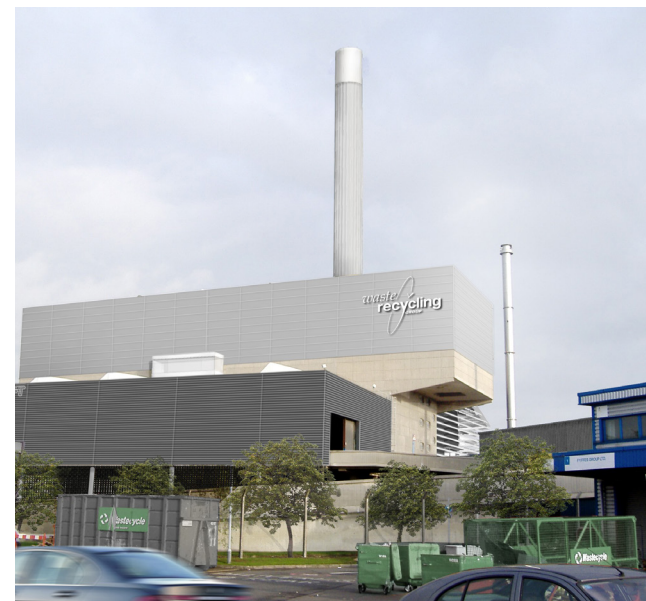
Central de Eastcroft, en Nottingham (Reino Unido).

“ Esta operación es pionera desde el punto de vista de calificación crediticia en Reino Unido ”