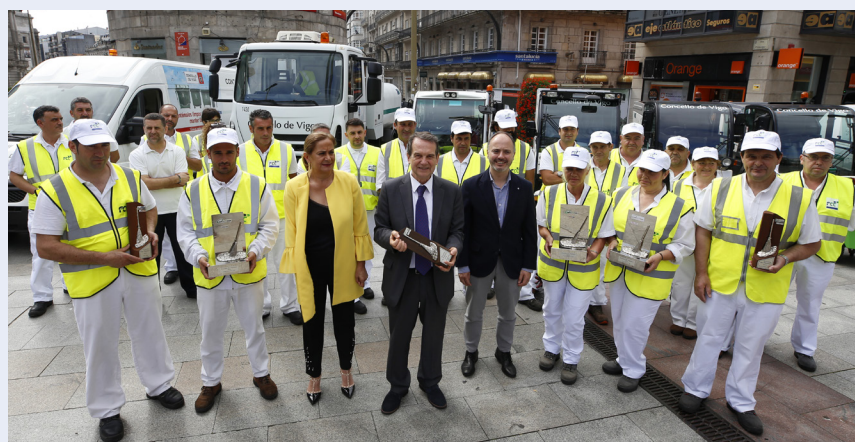
Abel Caballero, alcalde de Vigo, con la sexta "Escoba de Platino" en la mano, celebra la entrega del galardón con los trabajadores del servicio de limpieza de la ciudad.

Este compromiso de la ciudad con la limpieza está también presente en el video realizado por varios operarios del servicio de limpieza de FCC para la televisión local, en el que, desde su propia experiencia muestran su entusiasmo y afán por mejorar la limpieza e imagen de la ciudad que acumula ya cinco "Escobas de Platino".