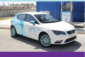
Aqualia lidera el proyecto Smart Green Gas