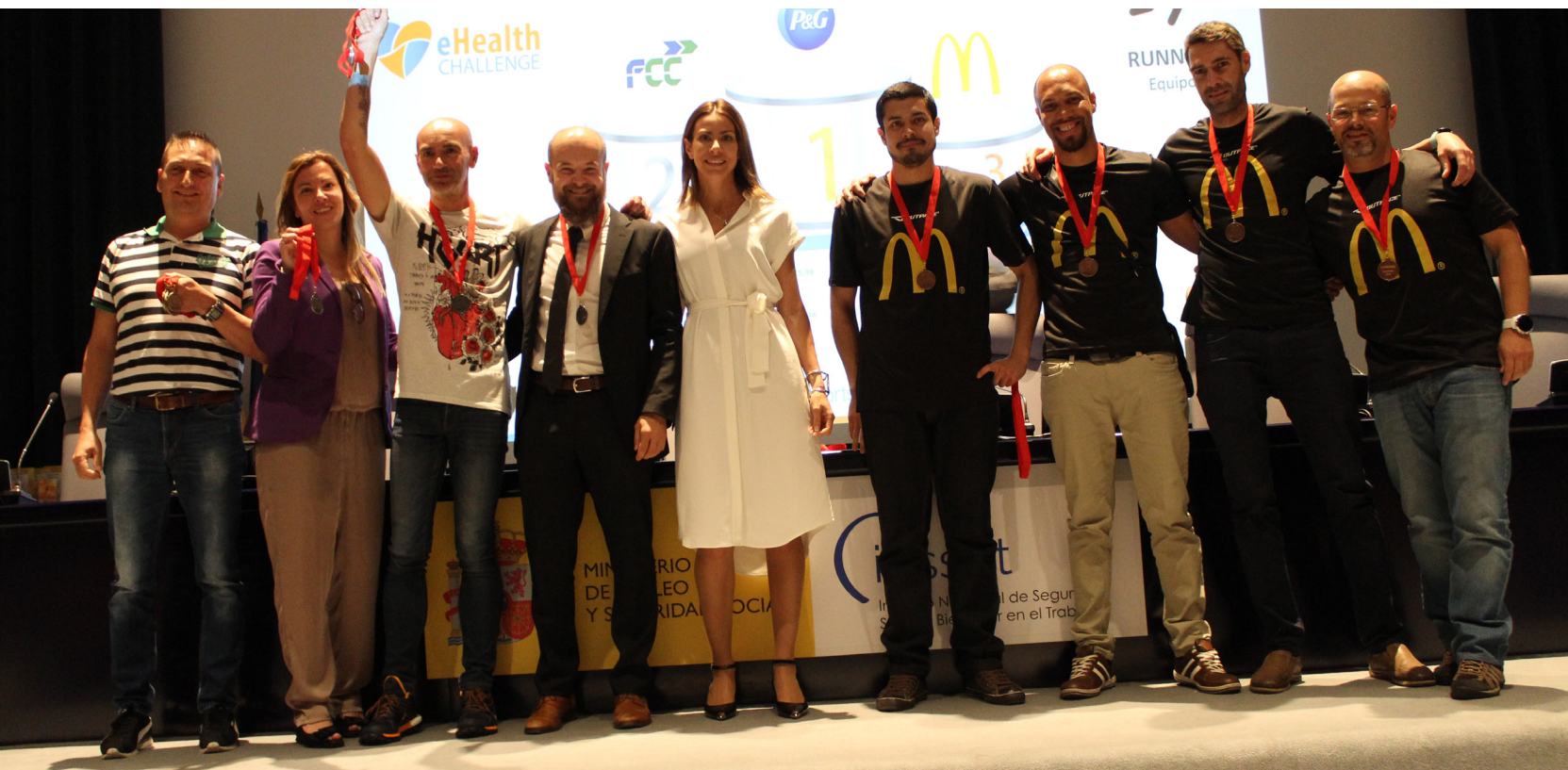
Empleados de FCC, galardonados en la segunda edición del eHealth Challenge, la mayor Olimpiada entre empresas con carácter solidario.

la mayor olimpiada online interempresas del mundo